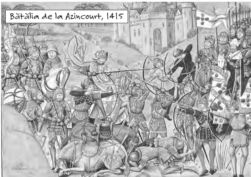
Bătălia de la Azincourt, 1415

nu aparțineau toți aceleași religii. Se băteau pentru femeia iubită. Dar mai ales se băteau pentru a cuceri teritorii noi.